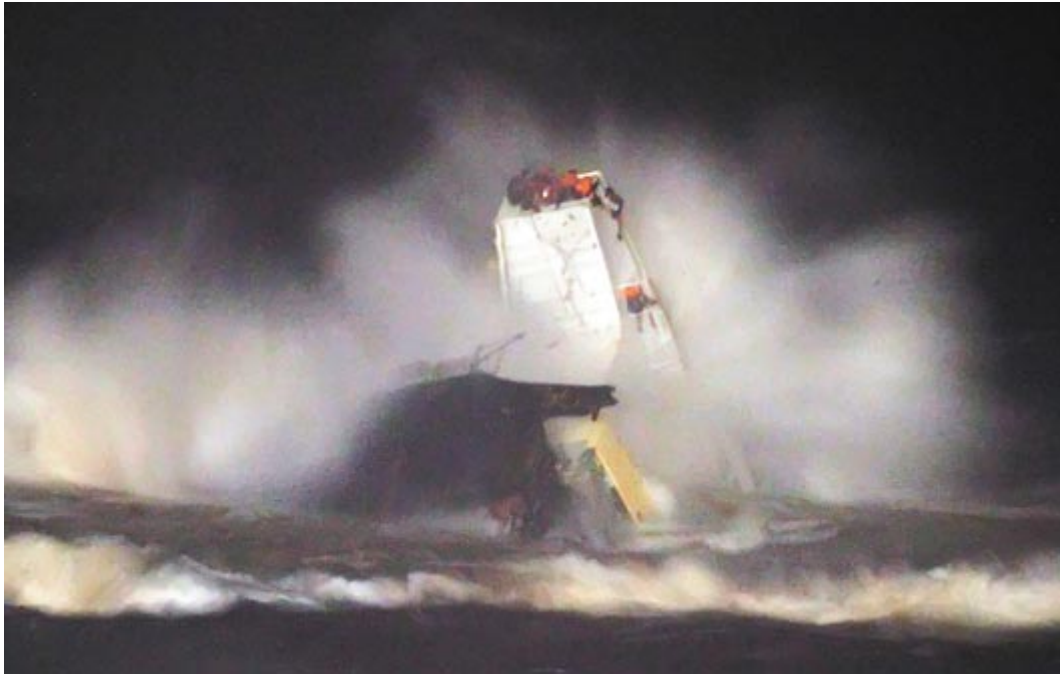
20111003 巴拿馬籍砂石船瑞興輪，在基隆港西方約二點六浬處岸邊觸礁，船身斷成兩截，船上共廿一名船員，十多人落入海中，而留在斷裂船身上的船員(攀附在白色船身頂端)不停受到大浪拍打，情況危急。 http://udn.com/NEWS/NATIONAL/NAT2/6630197.shtml#ixzz1aM0vv7tb